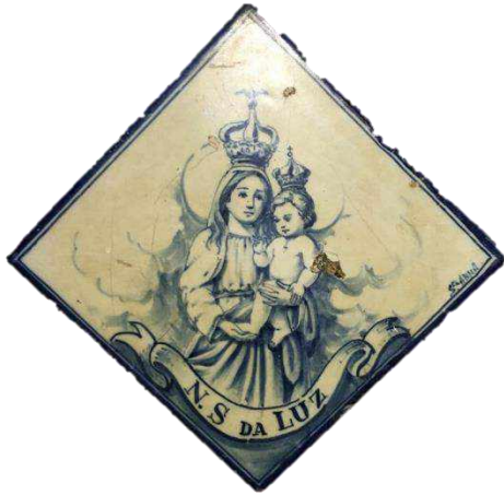
Fontanário da Achada de baixo