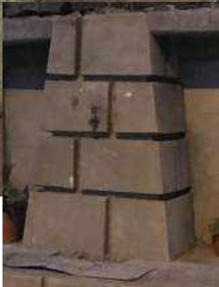
Fontenário da Rocha do Gato/ Rampa do quiosque

Morada: Cruzamento entre a Estrada Padre Alfredo Vieira de Freitas e o Caminho José Pereira de Nóbrega