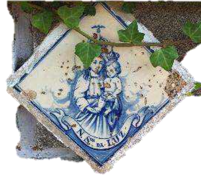
Fontanário da Rua do Pomar (em frente a casa do Senhor Eugénio)